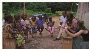
Atelier d'éveil à la lecture - Août 2017 - village d'Adingnigon

venir en aide aux enseignants, aux enfants et aux parents bien après notre passage. En appui avec la méthode de lecture La planète des alphas, adaptée aux enfants de 3 à 7 ans, nous souhaitons mener cette expérience afin d'éveiller les enfants à la lecture et ainsi leur faciliter son futur apprentissage.