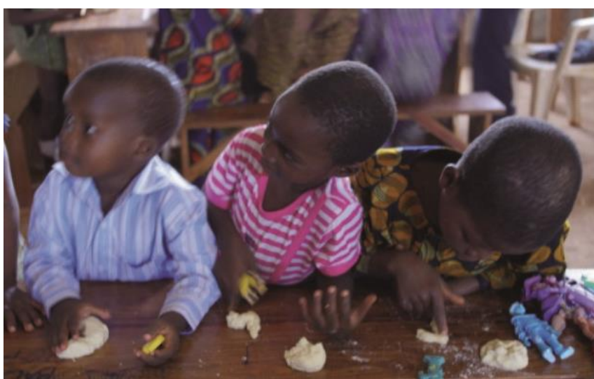
Atelier d'éveil à la lecture - Août 2011 - village d'Adingnigon

Et quelle victoire pour nous ?! Celle qui vous donne l'envie de repousser les limites et de continuer votre action, auprès de cette population, de manière plus définie, plus organisée, plus concrète afin d'en attendre de meilleurs résultats.