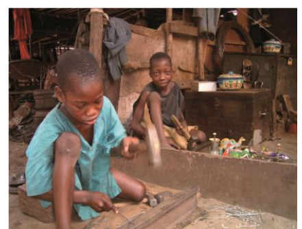
Enfants travaillant au marché dans la ville de Cotonou

Les enfants victimes de trafic sont employés comme domestiques dans les foyers, ouvriers dans les plantations, vendeurs ambulants et comme travailleurs dans les entreprises commerciales, industrielles, artisanales.